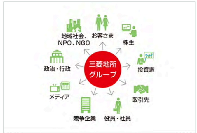
ステークホルダーとの関係

これらの目的を考慮し、各ステークホルダーとの最適なエンゲージメント手法を検討し、実施しています（以下、各ステークホルダーとの対話方法参照）。当社グループは、ステークホルダーエンゲージメントを通じていただいたご意見を当社グループの事業に生かすこと、そして双方向のコミュニケーションを通じてステークホルダーからの信頼、信用を得続けることで、持続的な事業継続に繋げていきたいと考えています。