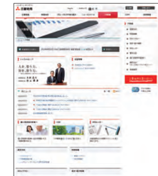
IR情報トップページ(日本語版)

http://www.mec.co.jp/e/investor/index.html