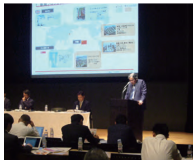
アナリスト向け説明会(2012年5月)

さらに、外国人投資家の皆さまとのコミュニケーションをより一層推進するために、英文でのIR情報の発信やファクトブックの充実を継続して図っています。