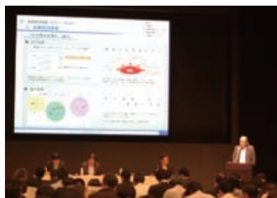
アナリスト向け説明会(2011年6月)

さらに、外国人投資家の皆さまとのコミュニケーションをより一層推進するために、英文でのIR情報の発信やファクトブックの充実を継続して図っています。