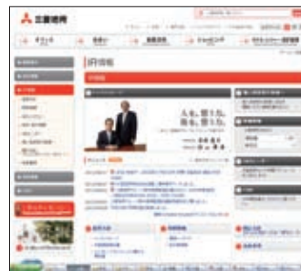
IR情報トップページ(日本語版)