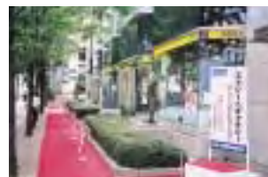
ストリートギャラリー2000 オープニングレセプション(名古屋)

ストリートギャラリー 豊かな憩いと潤いの提供を目指し、丸の内・名古屋・広島の事業地域の通りに、彫刻を展示しています。毎年、展示の彫刻を入れ替え、緑の木々と彫刻の調和をはかっています。